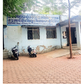
हरिभूमि न्यूज | ब्यावरा

जिले भर के हाल बेहाल, विभाग के कर्मचारियों के परिजन ही ले रहे हैं कंपनी का ठेका