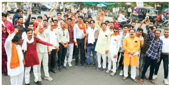
हरिभूमि न्यूज | राजगढ़

पांच दिवस पहले एक युवक से पुलिस एसआई ने की थी मारपीट